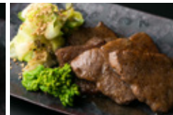
宮崎牛トモサンカク焼き バターポン酢ソース 5枚 1900