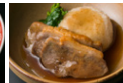
鴨ロースの治部煮 蓮根万頭添え 3枚 850