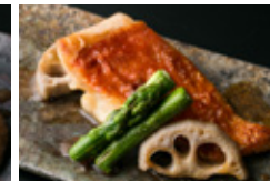
金目鯛のソテー バターポン酢 2500