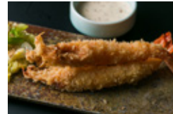
天使の海老フライ 玉ねぎポン酢マヨネーズ 3本 1100