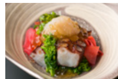
真蛸と炙りホタテの サラダ仕立て 柚子胡椒ジュレ 950