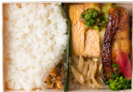
銀だら西京焼き弁当 1600