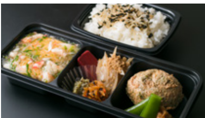
出汁巻き玉子弁当 1300