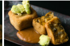
鮑のクリームコロッケ 海老味噌で 2枚 2700