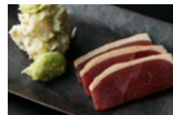
京鴨生ハム しば漬けの ポテトサラダ添え 3枚 950