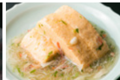
出汁巻き玉子 蟹あんかけ 800