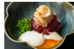
鮭のユッケ風 トリュフ醤油 温玉添え 1000