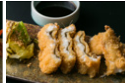
穴子のフライ バルサミコ醤油で 半身 1900