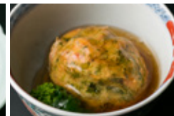
桜海老と生のりのひろうず べっこうあんかけ 800