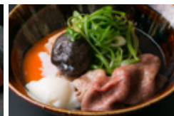
宮崎牛肩ロースの 肉豆腐 温玉添え 2400