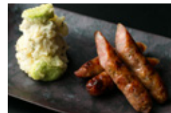
ソーセージ粕漬け しば漬けのポテトサラダ添え 750