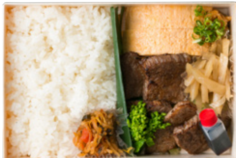
宮崎牛 トモサンカク焼き弁当 2300