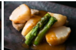
ホタテの ウニソース焼き 2枚 1200